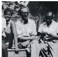
Le Corbusier, Pierre Jeanneret, Charlotte Perriand

Nel 1922 Le Corbusier dà inizio ad una attività professionale presso il nuovo atelier di rue de Sèvres a Parigi insieme al cugino Pierre Jeanneret col quale condivide ricerche e criteri di progettazione con intesa profonda e duratura, testimoniata per tutta la vita.